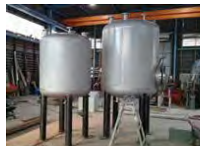
ステンレスタンク