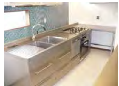
SUS製オーダーキッチン